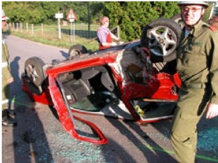
Verkehrsunfall auf der Kleinraminger Landesstraße am 19.09.2003

Das rechte Bild zeigt den Brand der Jagdhütte in Ebersegg am 03.10.2003.